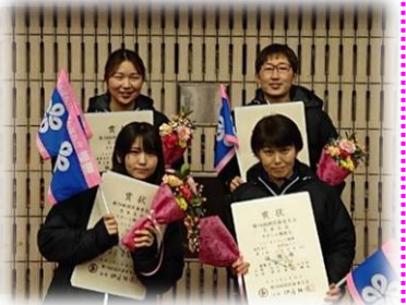
【成年女子リレーチーム】

スケート競技会 男女総合成績 8位 女子総合成績 5位 アイスホッケー競技会 総合成績 7位