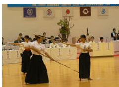
【なぎなた 少年女子】