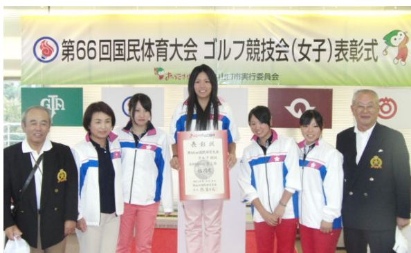
【2連覇を達成した女子チーム】

「プレッシャーに負けずにキャプテンがチームを良くまとめてくれた。この結果に満足することなく、今後もさらに頑張っていきたい。」