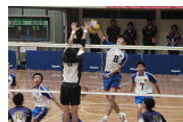
【バレーボール 少年男子】