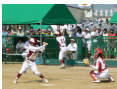
【ソフトボール 少年女子】