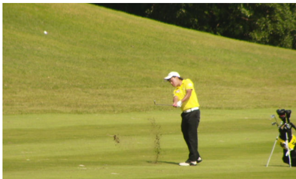
【グリーンを狙った気迫のショット！】