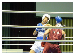
【ボクシング 少年男子】