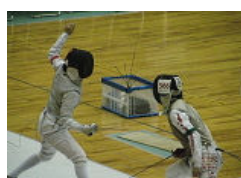
【フェンシング 少年女子】