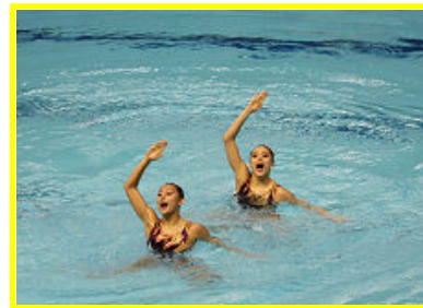
横竹ペアの華麗な演技

昨年の国体では、9位に終わったことが悔しくて、本年度は5位入賞、最低でも8位入賞を目標に山口に乗り込みました。テクニカルルーティン終了時点では不安がありましたが、フリールーティンでは、緊張せず、冷静にダイナミックさを失わないように気をつけて演技を行いました。今回の成績には満足しているし、8位内入賞の目標に貢献できてうれしいです。来年は表彰台に立てるよう頑張ります。