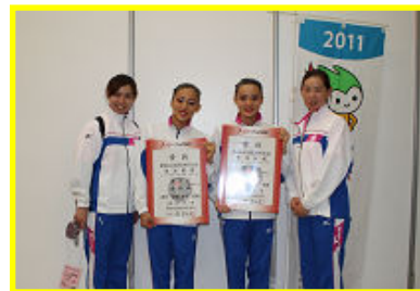
喜びに包まれたシンクロチーム